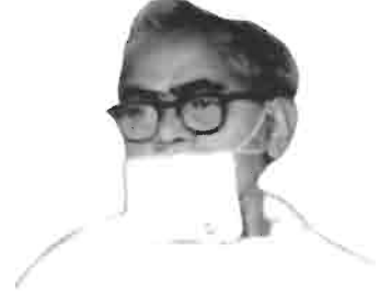
તત્પજ્ઞ નવલ ગુરૂદેવ

માતૃશ્રી કાશીબેન સુરજી વીરજી ગડા જૈન ધર્મસ્થાનક